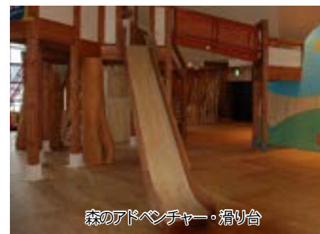
森のアドベンチャー・滑り台