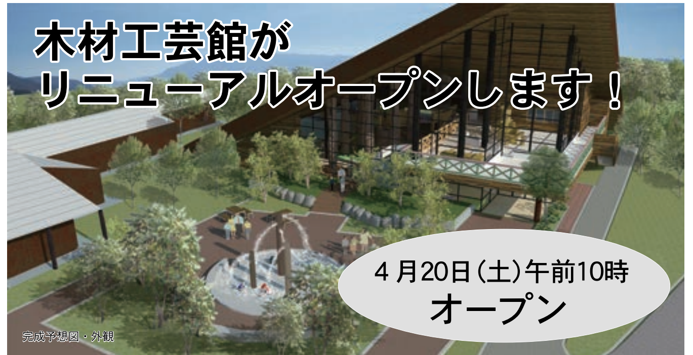
完成予想図・外観