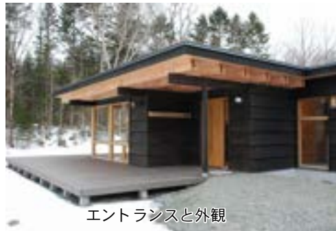
エントランスと外観