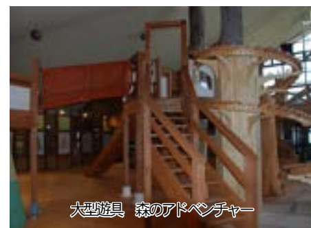
大型遊具 森のアドベンチャー