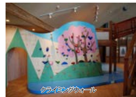
クライミングウォール