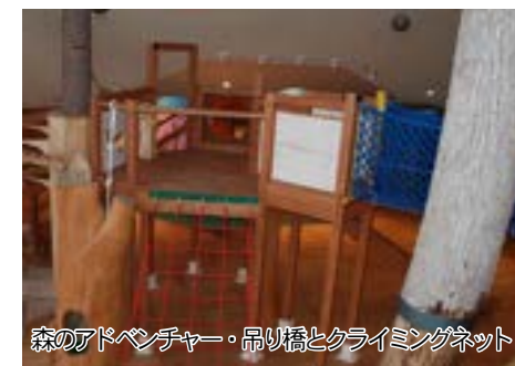
森のアドベンチャー・吊り橋とクライミングネット

木材工芸館は、より一層「愛林のまち」を象徴する施設に生まれ変わりました！ 吹き抜けの空間には巨木が並び、津別の木をふんだんに使った大型遊具やクライミングウォールなど、木とふれあい、木に学ぶことができ、子どもたちの豊かな心を育むことができます。そのほか、津別の産業や歴史を紹介する展示パネル、津別のウッドクラフト販売コーナー、屋外には噴水広場もあり水遊びもできます。 親子連れ、地域住民、観光客、みんなが楽しめる憩いの場ですので、ぜひ遊びに来て下さい。