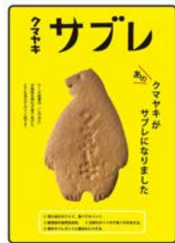
▲クマヤキサブレのパッケージ

存在であり、会社と地域と町が連携して稼ぐ事業を展開する好例となっております。今年3月に設立された、まちづくり会社も地域商社としての機能を持ち、町を元気にする取り組みを企画しています。