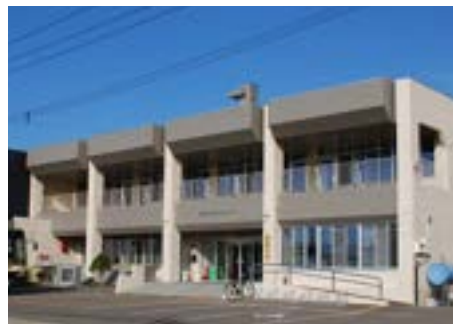
津別町振興公社損益計算書 単位：千円 (平成30年4月1日から平成31年3月31日まで)

また、これらの業務を実施するにあたり、正規職員、パート・臨時職員、季節職員の総数58人体制で業務を行いました。