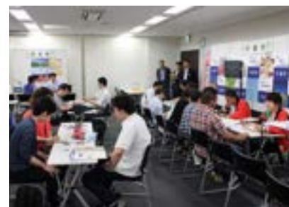
▲移住相談会の様子

津別町のブースにも、たくさんの方が足を運んでくださり、仕事、住まい、子育てなどの率