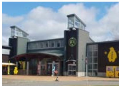
相生振興公社損益計算書 単位：千円 (平成30年4月1日から平成31年3月31日まで)

職員配置については、地域おこし協力隊は退任し、正規職員及びパート職員の総数15名体制で業務を行いました。