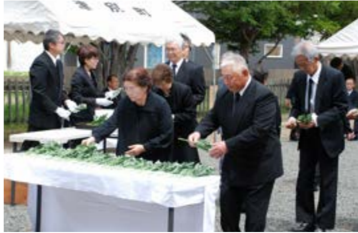
▲平和の碑の前で献花する追悼式参列者

来賓による慰霊の辞の後、参列者全員が平和の碑前で献花を行い、恒久平和への誓いを新たにしました。