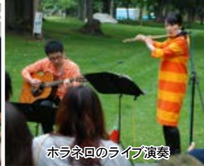
ホラネ回のライブ演奏