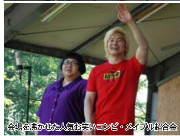
会場を沸かせた人気お笑いコンビ・メイプル超合金