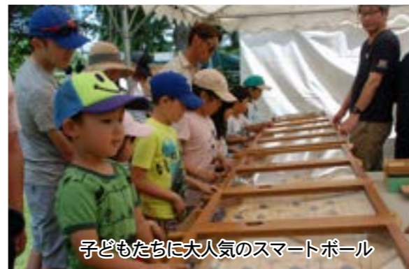
子どもたちに大人気のスマートボール