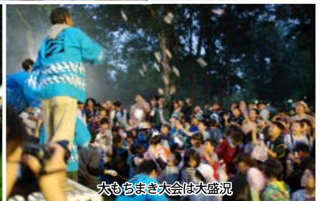
大もちまき大会は大盛況