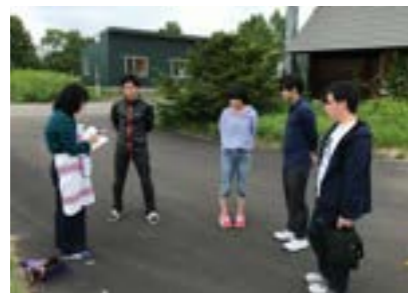
▲各班のリーダー達

津別ファンの獲得を目指す「津別留学班」などの事業を展開してきました。今年度についても前年実施した前述の事業については継続して実施していく予定であり、これらにプラスして、町のイメージキャラクターである「まる太くん」を活用して津別町の認知度アップや地域の活性化などを目的とした活動を行う班や、新規企画として津