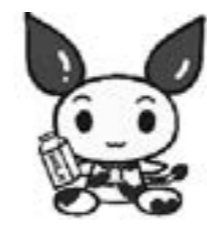
けんけつちゃん (北海道バージョン)

血液が足りません!! 献血にご協力をお願いします 移動献血車「ひまわり号」が来町します。 皆さんの温かいご協力をお願いします。 【1日目】9月3日(火) 場所・時間 役場議事堂前 午前9時30分～11時30分 午後1時～3時 ・津別高校前 午後3時30分～4時30分 【2日目】9月4日(水) 場所・時間 役場議事堂前 午前9時30分～正午 丸玉木材株式会社前 午後1時30分～4時30分 ※当日献血にご協力いただいた皆さんには、津別ライオンズクラブからプレゼントがあります。 問い合わせ先 保健福祉課健康推進係 ☎76-2151 (内線234)