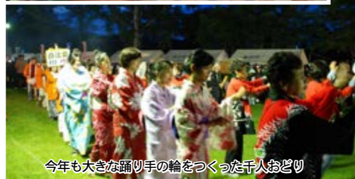
今年も大きな踊り手の輪をつけた千人おどり