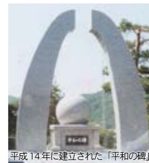
平成14年に建立された「平和の碑」

今年で74回目の終戦記念日を迎えます。しかし、今なお広島・長崎の原爆の後遺症に苦しむ多くの人たちがいます。 核も戦争もない平和な世界は人類の願いでもあります。津別町は、平成10年9月に左記の「非核・平和の町宣言」を行い、核兵器の廃絶を訴えています。 また、平成14年には町の忠魂碑跡地に「平和の碑」を建立し、恒久平和の実現を願っています。さらに平成21年に、連帯して世界恒久平和の実現を願う「平和市長会議」に加盟しました。