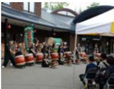
▲山鳴太鼓保存会の演奏に聴き入る

「第14回クリンソウまつり」が、6月22日・23日の二日間、津別町民の森自然公園（愛称・ノノの森）とランプの宿森つべつで開催されました。 今年も多くの方が会場を訪れ、可憐なクリンソウの花が咲く散策路を歩いたり、数々の体験イベントを楽しむなど、初夏の一日を満喫しました。 森の音楽会では、津別郷土芸能・山鳴太鼓保存会の勇壮な演奏や地元音楽家、音楽愛好会の演奏に聴き入り、またオープンしたばかりの自然体験の拠点・ネイチャーセンターも賑わいを見せました。