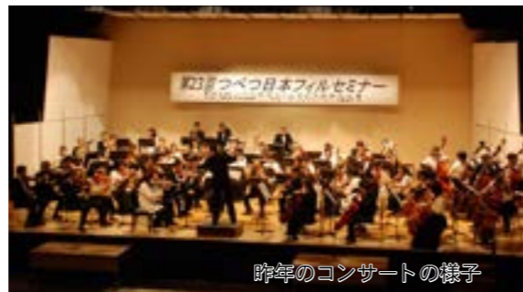
昨年のコンサートの様子

■演奏曲 ・チャイコフスキー:交響曲第1番 ・チャイコフスキー:『白鳥の湖』より