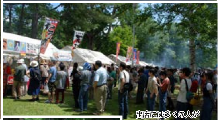
出店には多くの人が列を作りました