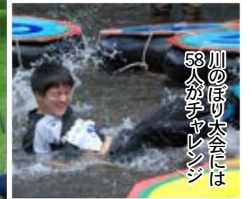
川のぼり大会には53人がチャレンジ