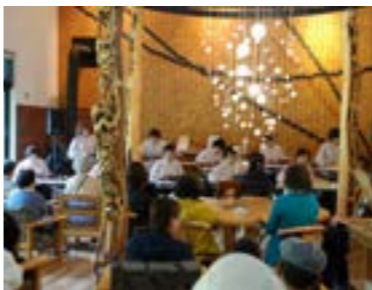
▲琴伝流大正琴瑠璃の会の演奏