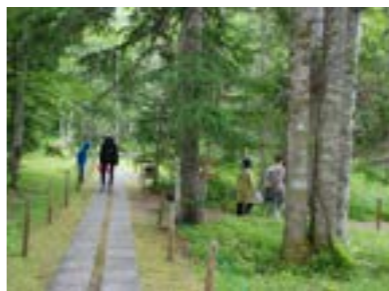
▲クリンソウが咲く散策路