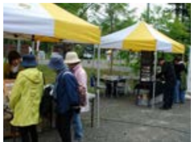
▲販売・物作りのブース