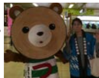
▲催事にて、まる太くんと

今年はテレビや旅番組の専門チャンネルで津別町を宣伝させていただく機会があり、出演させていただきました。