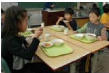
▶つべつ和牛を使った牛丼は子どもたちに大好評