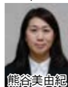
津別町⇄東京都⇄津別町のUターン組。津別観光協会、さんさん館勤務。

令和元年も残すところあとひと月となりました。一年を振り返ると、「今年のおまつりは天候に恵まれて本当に良かった。」につきます。昨年は雨で盆踊り大会が中止となりました。どのおまつりも数か月前から準備を始めています。直前に祈るのは、「当日、どうか雨になりませんように。」です。