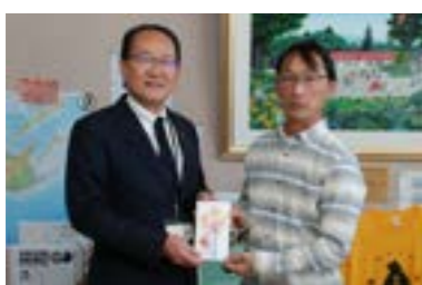
▶目録を手にする宮管教育長（左）と北野会長

寄贈された牛肉は、全て地場産物の食材を使用する『オール津別給食』期間中の11月19日に、牛丼として提供されました。