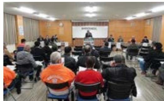
▼歳末特別警戒結団式の様子