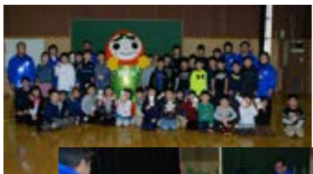
▲人権カルタの様子 ▲みんなで記念撮影

教室の最後には、人権キャラクター・まもる君が登場し、児童たちと一緒に記念写真に納まりました。