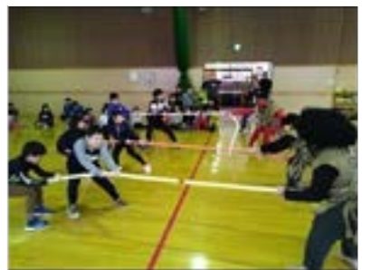
▲子どもたちと鬼の綱引き