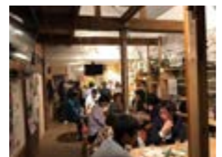
▶ジンバでの交流の様子

住民企画課 地方創生係 TEL 76-2151(内線241) e-mail: tsubetsu.sousei@gmail.com