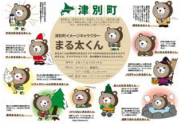
▶観光協会作成のポスター

提案の実現がモチベーションの維持へ繋がります。今年度も思いと町内のニーズがマッチし、成果が町内で活用されるような活動を実施していきたいと思っています。 団体内ではすでに次年度に向けた会議が繰り返し開催されており、2月には津別町を訪問し、町や津別高校とも打合せを実施したところです。次年度も、当町をフィールドとして活動予定であり、今年度同様に町民の皆様のお世話になることもあるかと思えます。継続して皆様からのご理解ご協力をいただけると幸いです。