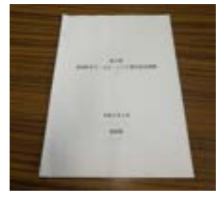
▲第2期津別町まち・ひと・しごと創生総合戦略

人口減少と地域経済縮小の悪循環を克服するため、第2期津別町まち・ひと・しごと創生総合戦略（令和2年度）を策定し、町ホームページにおいて公表いたしました。第1期の取り組みを継続