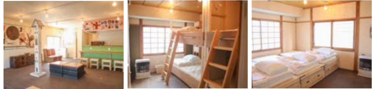
▲共用スペース ▲ドミトリールーム（相部屋） ▲個室（4人部屋）