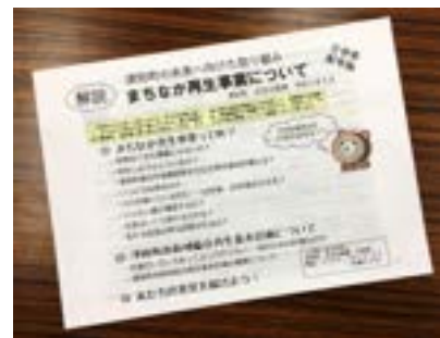
▲広報5月号の折込冊子

先月号の広報に折り込みました冊子「解説 まちなか再生事業について」では、現在建設中の役場複合庁舎が完成後、現庁舎や議事堂周辺をどのように再生していくのか、経過も含めて説明しています。まだ読まれていない方は、是非一読ください。