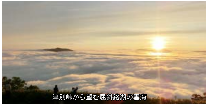
津別峠から望む屈斜路湖の雲海

展望施設からは、広大な屈斜路湖をはじめ摩周岳、知床連山などが望めます。気象条件があれば屈斜路湖をおおい尽くす壮大な雲海が眼下に広がります。