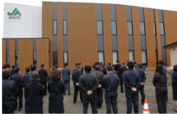
▶新事務所横で行われたオープン式の様子