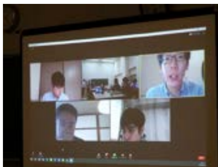
▶オンライン実施中の画面 (接続先は大学生)

札幌から津別への往来については見通しが立たない中ですが、大学生、高校生双方が最大限充実した取り組みとなるよう支援してまいります。