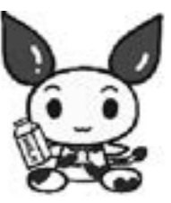
けんけつちゃん (北海道バージョン)

移動献血車「ひまわり号」が来町します。 皆さんの温かいご協力をお願いします。 【1日目】 9月8日(火) 場所・時間 ・役場議事堂前 午前9時30分〜11時30分 午後1時〜3時 ・津別高校前 午後3時30分〜4時30分 【2日目】 9月9日(水) 場所・時間 ・役場議事堂前 午前9時30分〜正午 丸玉木材株式会社前 午後1時30分〜4時30分 ※当日献血にご協力いただいた皆さんには、津別ライオンズクラブからたまごのプレゼントがあります。 問い合わせ先 保健福祉課健康推進係 ☎76-2151 (内線232)