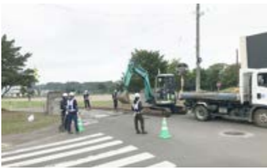
▶津別小学校裏口舗装整備工事の様子

平成30年に津別小学校小グラウンドの無償舗装整備を行っていたこともある地崎道路株式会社北海道支店による、津別小学校裏口舗装通路の無償舗装整備工事が8月1日に行われました。