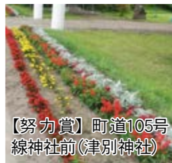
【努力賞】町道105号 線神社前（津別神社）

「津別町花のまち推進協議会」では、花いっぱい運動を育成助長することで、うるおいのある美しいまちづくりに寄与しています。 その一環として、今回で42回目となる花壇コンクールが実施されました。8月18日に協議会役員による審査会が開かれ、審査の結果、活汲農村公園花壇が2年連続で最優秀賞に選ばれたのをはじめ、全8花壇が入賞しました。 なお、表彰式は、11月中旬に開催予定です。