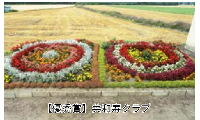
【優秀賞】共和寿クラブ