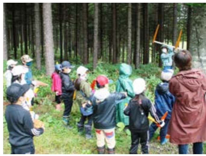
▶役場の林政係担当者から木の太さを測る道具の説明を受ける3年生の児童

津別町では、小学校3年生・5年生、中学校1年生を対象に年3回木育授業の時間を設けており、今回は今年2回目の授業でした。小中学校の木育授業は、平成21年度