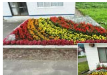
▼【優良賞】 東達美会館（東達美自治会女性部）