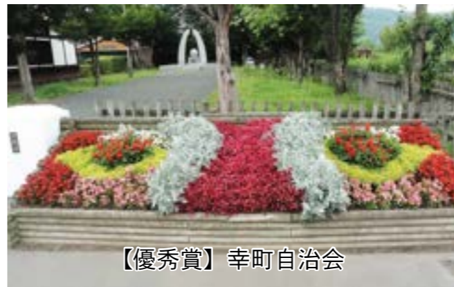
【優秀賞】幸町自治会