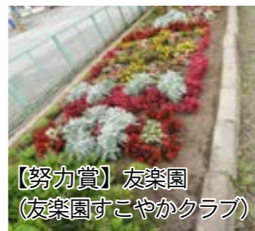
【努力賞】友楽園 （友楽園すこやかクラブ）