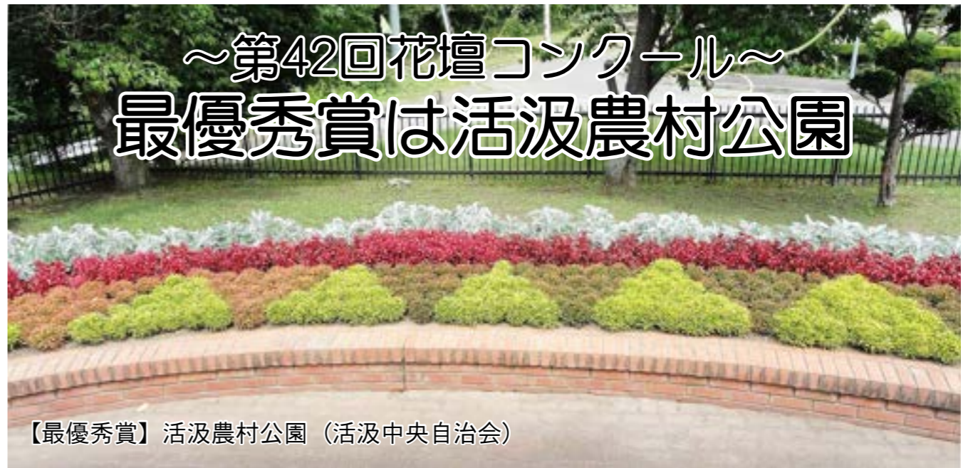
【最優秀賞】活汲農村公園（活汲中央自治会）