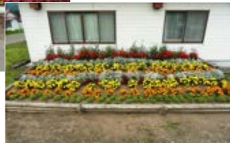
▲【優良賞】 豊永会館（豊永第一農事組合育苗団体）