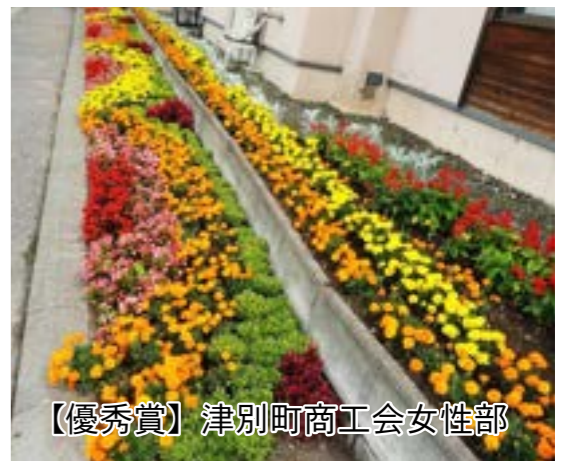
【優秀賞】津別町商工会女性部