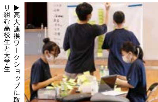
▶高大連携ワークショップに取り組み高校生と大学生

問い合わせ先 住民企画課企画係 ☎76-2151（内線241） e-mail: tsubetsusei@gmail.com