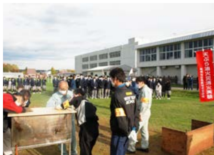
▶火災消火実験の準備をする美幌地区危険物安全協会の皆さん

津別高校生が火災の危険を学ぶ 危険物安全協会が火災消火実験実施 10月14日、美幌地区危険物安全協会主催の天ぷら油火災消火実験が、津別高校の校庭で行われました。 この実験は、天ぷら油による火災の危険性および消火方法について広く周知するとともに、火災の発生を未然に防止することを目的としています。 一般家庭でもあり得る火災の状況を実際に起こし、生徒達の前で天ぷら油による火災への対処を危険物安全協会の方が実演しました。