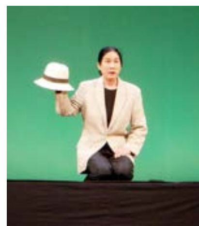
▲舞台を使ったリハーサルの様子

津別高校生が火災の危険を学ぶ 危険物安全協会が火災消火実験実施 10月14日、美幌地区危険物安全協会主催の天ぷら油火災消火実験が、津別高校の校庭で行われました。 この実験は、天ぷら油による火災の危険性および消火方法について広く周知するとともに、火災の発生を未然に防止することを目的としています。 一般家庭でもあり得る火災の状況を実際に起こし、生徒達の前で天ぷら油による火災への対処を危険物安全協会の方が実演しました。