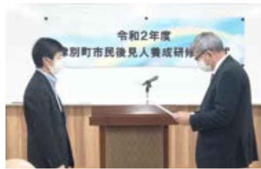
▶佐藤町長（右）から修了証書の授与を受ける受講者

11月10日、令和2年度津別町市民後見人養成研修の修了式が林業研修会館にて行われ、受講者10名に佐藤町長から修了証書が手渡されました。 養成研修は10月3日から始まり、全10回、30時間を超える講義や実習などから学び、最後に友澤太郎弁護士による講話「市民後見人への期待」を聴いて修了しました。