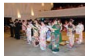
▲令和2年の成人式の様子

《LIVE配信について》 津別町を拠点とする「道東テレビ」さんのご協力により、成人式の模様を道東テレビ公式YouTubeチャンネルでLIVE配信いたします。 ●配信予定 令和3年1月10日(日) 13:30～ ※詳細な配信スケジュールが決まり次第、津別町HPでお知らせいたします。※当日の機材トラブル等により急遽配信できない場合があります。