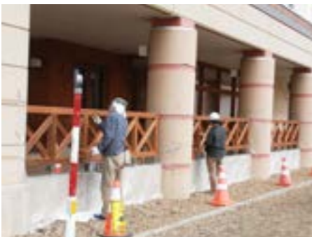
▶津別小学校体育館木製フェンス塗装整備の様子

11月13日、16日、19日と㈱丸田組、鐘ヶ江建設㈱、㈱丸七高橋組の3社合同による津別小学校体育館正面木製フェンスおよび津別中学校正面玄関木製フェンスの無償塗装整備が行われました。 オホーツク管内の建設会社3社による地域貢献事業の一環として実施されたもので、日に焼けてしまい黒く変色し、経年劣化によるささくれが出ている状態でしたが、やすり掛けし、防腐剤入りのペンキ塗装により見違えるようになりま