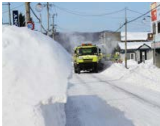
▲平成22年1月の大雪の様子