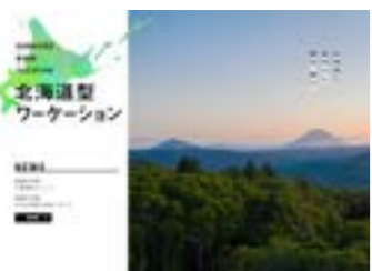
▲ポータルサイトのイメージ

昨年11月に北海道が実施主体（実務等は民間会社へ委託）の「北海道型ワーケーション導入検討・実証事業」に参加し、首都圏から5企業6名が実際に来町してテレワークや町内でのアクティビティなどを体験いただくという内容で受入を実施したところですが、今年度も同事業を北海道が実施主体として実施を継続しています。今年度については新型コロナウイルスの影響により首都圏からの往來を自粛している中でしたので実際の受け入れには至りませんが、次年度以降の継続的な取り組みに向け、本事業参加の39自治体とともに受け入れ環