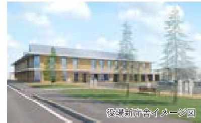
役場新庁舎イメージ図

新庁舎の建設に伴う「津別町役場庁舎等建設事業実施設計業務」の委託や、「公用車庫庫等建設工事」を行いました。