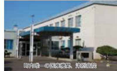
町内唯一の医療機関、津別病院

町内唯一の医療機関である津別病院に対して、救急診療を含めた医療体制や医療水準の確保に要する経費の一部を補助し、地域の安定した医療環境の維持につながるよう支援しています。