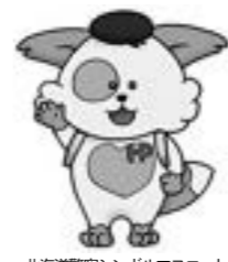
北海道警察シンボルマスコット ほくとくん

「ほくとくん防犯メール」は、犯罪から身を守るために必要な「子供被害情報」、「犯罪発生・防犯対策情報」、「お知らせ情報」を希望者のパソコン、携帯電話などにメールで配信するサービスです。 美幌警察署でも、防犯情報や犯罪の発生等についてのメールを随時配信しています。