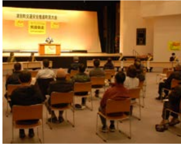
▲交通安全推進町民大会の様子

開会宣言の後、交通事故犠牲者への黙祷が行われ、昨年に町内で発生した死亡事故で尊い命が失われたこともあり、参加者は死亡交通事故ゼロへの思いを新たにしました。『第29回交通安全標語コンクール』の表彰では、小学生、中学生、高校生の部それぞれの最優秀賞のみの読み上げを行いました。続いて主催者・来賓の挨拶があり、交通事故死ゼロ日運動の確認で大会を終えました。