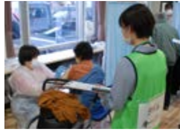
▲ワクチン接種シミュレーションの様子

4月8日、町民会館にて新型コロナウイルスワクチン接種に向けた会場運営シミュレーションを実施しました。町職員のほか、病院関係者や町議員、民生児童委員、ボランティアなど多くの方がシミュレーションに参加し、接種者が受付をしてから会場を出るまでの一連の流れについて、時間を計測しながら確認しました。