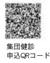
集団健診 申込QRコード