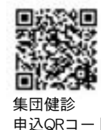
集団健診 申込QRコード

申込先 ☎ 保健福祉課健康推進係 役場7番窓口 0152-77-8380 (平日午前8時30分～午後5時15分)