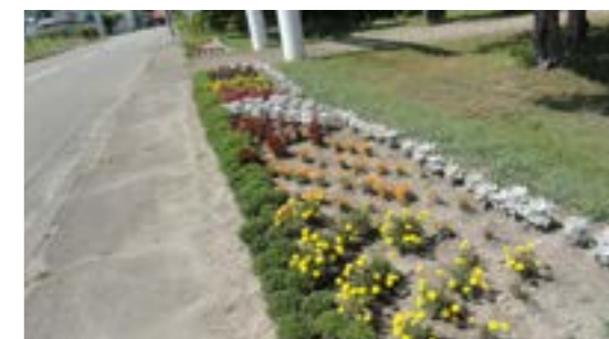
町道105号線神社前 (津別神社)