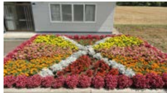
豊永会館 (豊永第一農事組合育苗団体)

※毎年花壇コンクールが実施されていますが、今年は新型コロナウイルス感染症拡大防止のため、中止となっています。