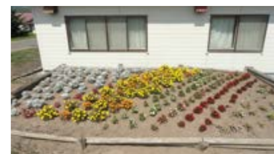
東達美会館 (東達美自治会女性部)