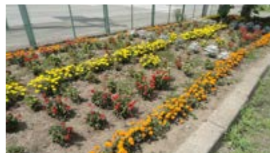
友楽園 (友楽園すこやかクラブ)