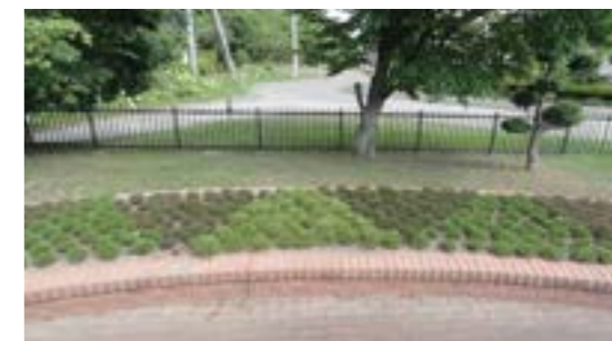
活汲農村公園 (活汲中央自治会)