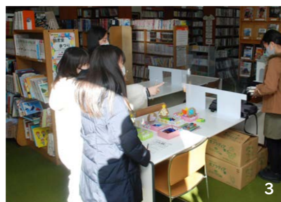
1. 古本市の様子 2. 読書チャレンジ参加者の作品 3. 図書室クイズに挑戦中