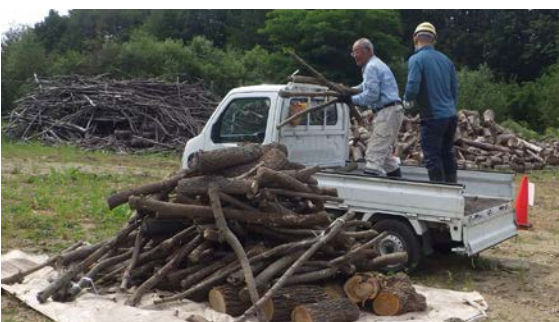
つべつウッドロスマルシェ模擬開催の様子

現在、津別町森林バイオマス利用推進協議会では、木質バイオマスセンターの本年4月稼働に向け、受け入れ手順や材の買取価格等の仕組みづくりを目的につべつウッドロスマルシェ実証事業を行っています。 昨年8月27日には、つべつウッドロスマルシェの模擬開催を中間土場（旧本岐中学校グラウンド）にて行い、合計1,550kgの木材が町内外から集まりました。 取り組みについて、意見や質問を皆さまからいただくことを目的に、昨年11月24日に再エネ勉強会を開催しました。町内外から合計16人（web参加含む）の方が参加し、模擬開催の結果報告の後、意見交換を行いました。