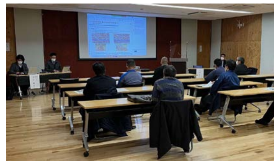
再エネ勉強会の様子

現在、津別町森林バイオマス利用推進協議会では、木質バイオマスセンターの本年4月稼働に向け、受け入れ手順や材の買取価格等の仕組みづくりを目的につべつウッドロスマルシェ実証事業を行っています。 昨年8月27日には、つべつウッドロスマルシェの模擬開催を中間土場（旧本岐中学校グラウンド）にて行い、合計1,550kgの木材が町内外から集まりました。 取り組みについて、意見や質問を皆さまからいただくことを目的に、昨年11月24日に再エネ勉強会を開催しました。町内外から合計16人（web参加含む）の方が参加し、模擬開催の結果報告の後、意見交換を行いました。