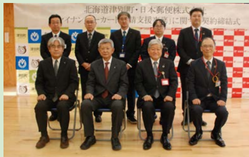
▲マイナンバーカード申請支援事務に関する契約締結式

郵便局で申請する場合は持ち物等は必要ありません。営業時間は平日午前9時～午後5時まで(年末は30日まで営業・年始は4日から営業)となりますので、ぜひご利用ください。