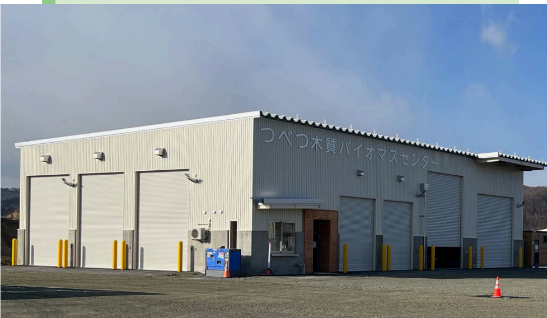
建設中のつべつ木質バイオマスセンター