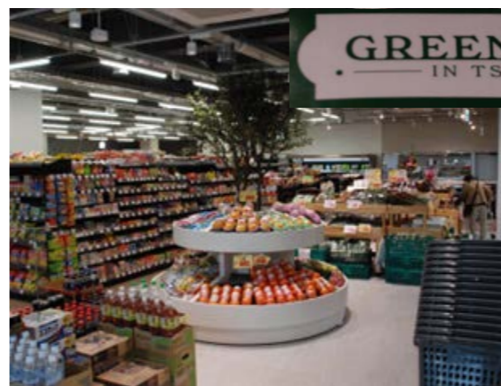
▲新装オープンとなったスーパーマーケットは、名称を従来の「グリーンマートつべつ」から「グリーンマートINつべつ」へ