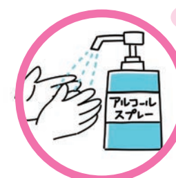
消毒用アルコール