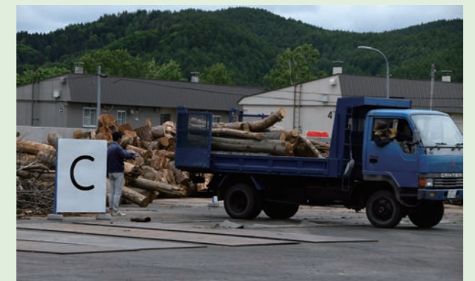
6月10日に行なわれた第1回ウッドロスマルシェの様子

日時 7月22日(土) 午前9時～正午 場所 津別町木質バイオマスセンター (津別町字達美213番地1)