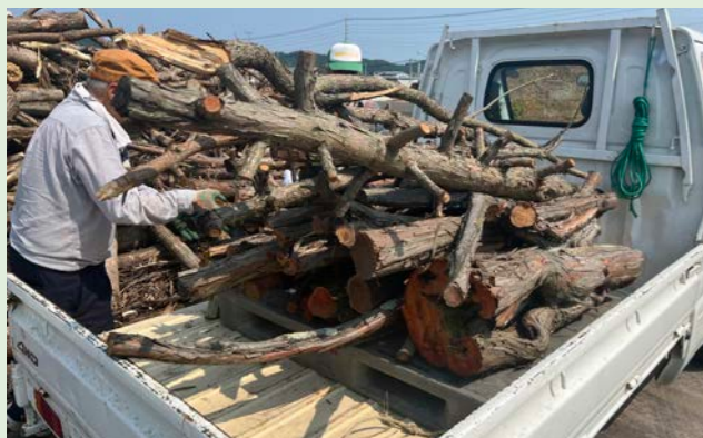
つべつウッドロスマルシェの様子