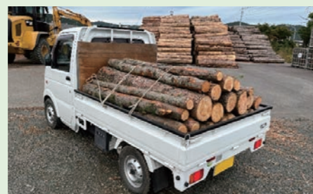
つべつウッドロスマルシェの様子

次回開催日につきましては来年の5月を予定していますが、開催日以外の買い取りも随時受け付けていますので、下記までご気軽にお問い合わせください。