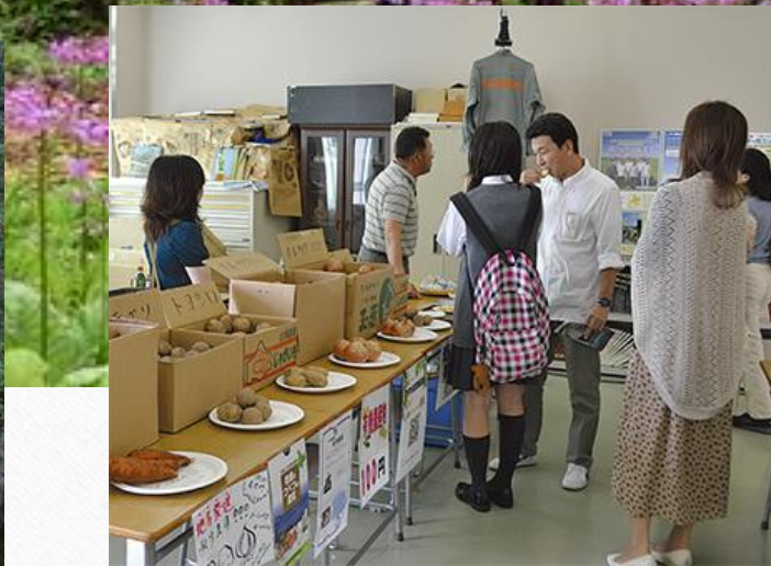
申し込み番号C-4:【限定30セット】流水牛糞沢三昧セット