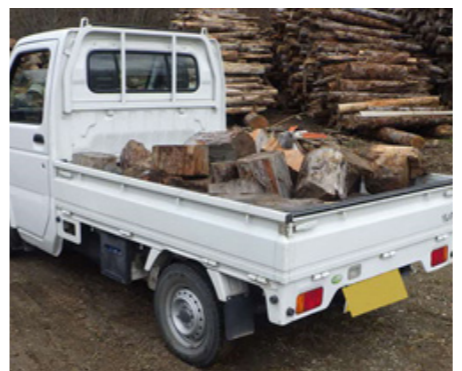
規格B積込イメージ(軽トラ最大積載(350kg))

つべつウッドロスマルシェは、どなたでも参加することが可能です。規格ごとに材を受け入れし、有価物として買い取る予定です。ご家庭で出る庭木支障木や剪定枝等も受け入れられます。※表1は目安として示しており、実際の買取価格は異なる場合があります。買い取った材は用途別に加工し、チップ（エネルギー用、農畜産用）や薪（家庭用ストーブ、キャンプ用、スウェーデントーチ）として利用を予定しています。