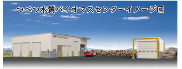
つべつ木質バイオマスセンターイメージ図

つべつ木質バイオマスセンターは、地域資源である木質バイオマスを利用し、収集・受け入れ（買い取り）・チップ加工（薪含む）・販売・運搬等を一手に担う設備として機能する予定です。製造された製品は、林業・農業など産業界での幅広い利活用も視野に入れていきます。