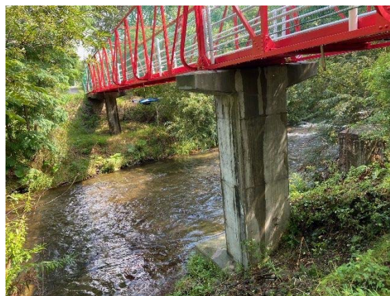
新技術（ドローン）による点検状況