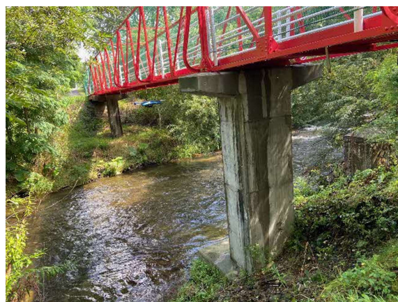
新技術（ドローン）による点検状況