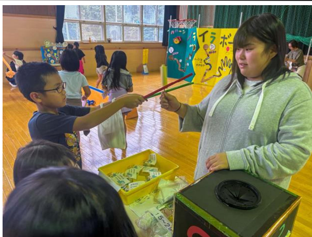
高校生ボランティアサークルひまわり 「じどうかんフェスタ」お手伝い