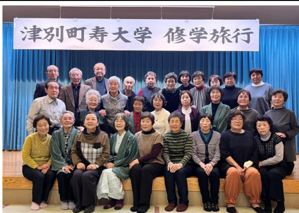
寿大学「修学旅行 in 知床」