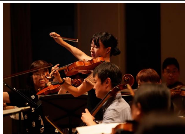
日本フィルセミナー・コンサート