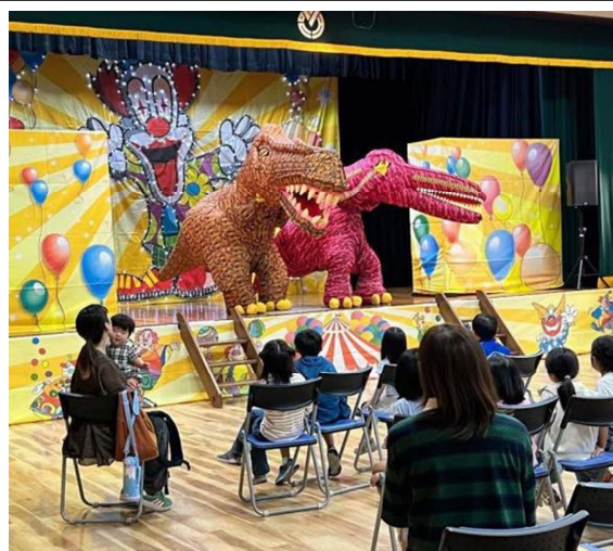
子ども芸術劇場 「ピエロと恐竜のスーパーサーカス」