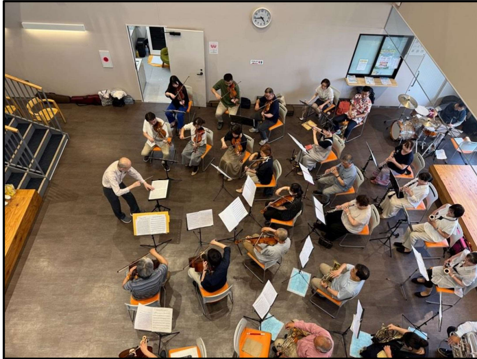
開館記念コンサート