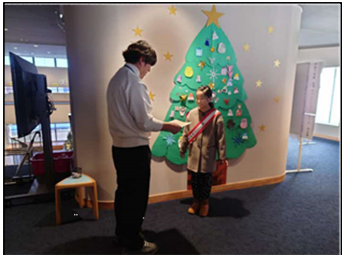
スタンプをあつめてこども図書館長をめざそう