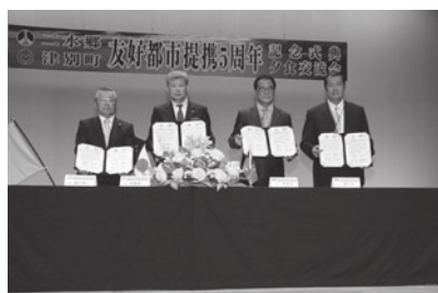
台湾二水郷・津別町宣誓証書署名・交換