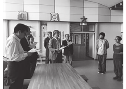
相生アートコミュニティ施設の現地視察