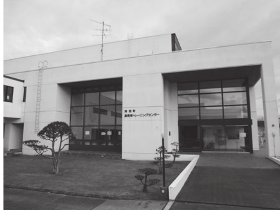
増築工事を行うトレーニングセンター（上） 増築箇所（左上）現トレーニング室（左下）