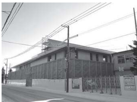
役場新庁舎建設の様子（1/6撮影）

「新たなにぎわいの創出」を目的とし、5つのコンテンツを包含するコミュニティゾーンの形成を実現するために議論を重ねてきました。7月のプロポーザル公募により、優先交渉権を持つ開発事業者も決定しましたが、予定していたドラッグストアの店舗が見送られ、ほかにも建て方や構成内容、事業主体の変更、補助金の変更など課題を残していることから計画の見直しが必要と判断しました。 現在、理事者側において計画見直しの作業が進められています。新たなドラッグストアと交渉中であり、再提案には時間を要するものと考えています。また継続審議が必要と考えていますが、2月で議員任期が満了いたしますので委員会を閉じ、最終報告とさせていただきます。 今後につきましては、改選後の議会で、必要な体制を整えて議論していきたいと思っております。 最後になりますが、委員会の調査研究中におきまして、町民の皆さまから、たくさんのご意見をいただきましたことにより感謝申し上げます。議員一同今後も町民の皆さまの代表として、明日の津別町のために一層の努力を重ね、皆さまのお役に立ちたいと考えています。ご協力ありがとうございました。