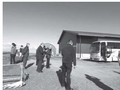
畜産クラスター事業実施箇所の 現地視察(11/5)