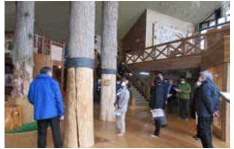
木材工芸館キノス（館内展示樹木）の現地視察（6/3）