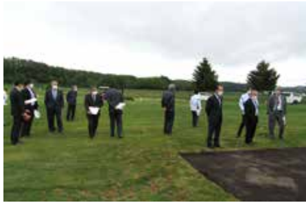
パークゴルフ場（芝生補修）の現地視察（5/31）