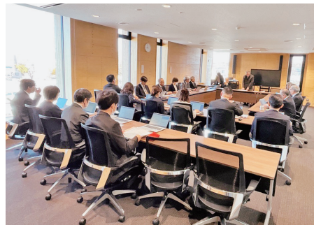
産業福祉常任委員会