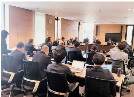
総務文教常任委員会