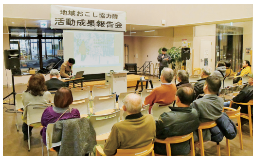
地域おこし協力隊活動成果報告会