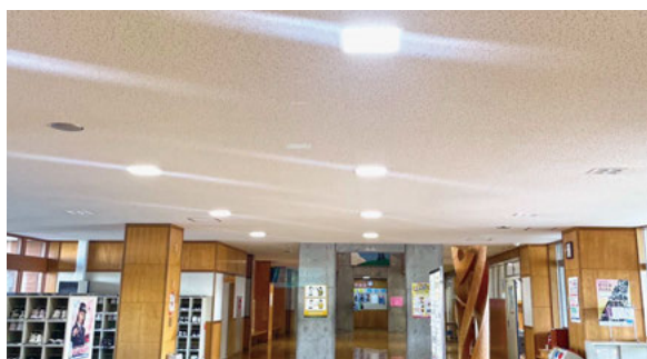
照明LED化改修工事中の中学校玄関ホール

契約の方法 指名競争入札 契約金額 7千425万円 契約の相手 株式会社 土田電業社