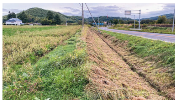
更新工事予定箇所（共和国道240号沿い）

次の工事の契約締結について、可決しました。 ○恩根地区農業水路等長寿命化・防災減災事業送水管更新工事 工事の場所 共和