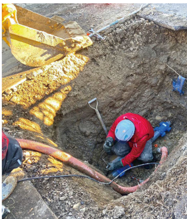
水道管修繕工事の様子